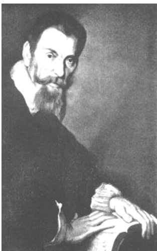
Claudio Monteverdi (zeitgenössisches Gemälde)