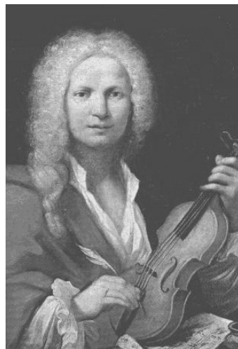
Antonio Vivaldi (zeitgenössisches Gemälde)